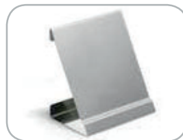
Pratica staffa per display The practical bracket for the display box