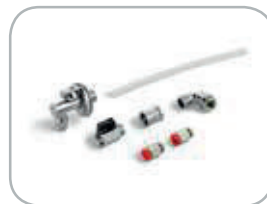
Kit collegamento scarico acqua opzionale Optional water discharge device connection kit