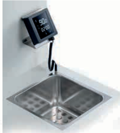
SOFTCOOKER SR BI 2/3 WI-FOOD